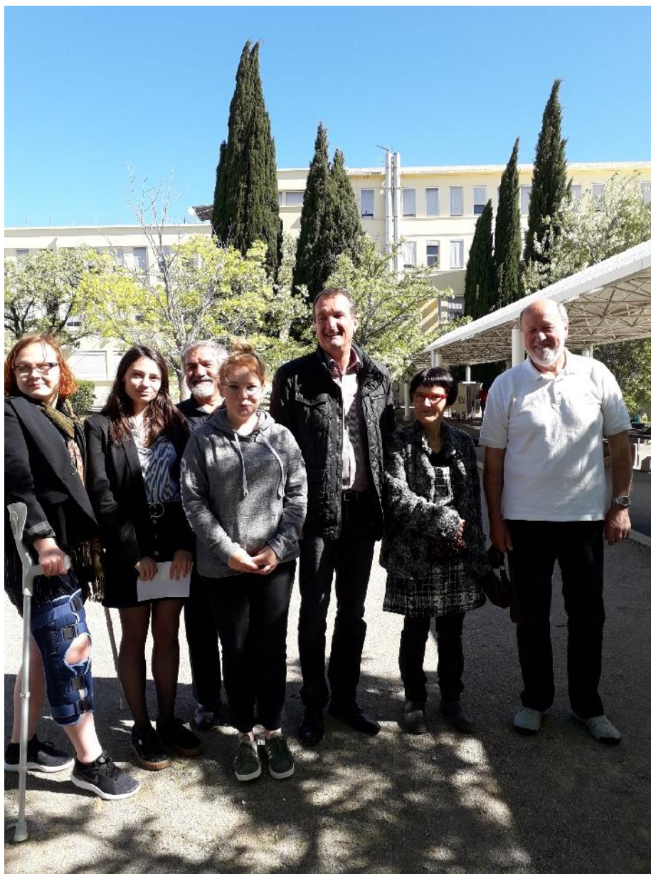
Des membres du club Bénin et du Rotary-club Templiers avec le maire de Draguignan