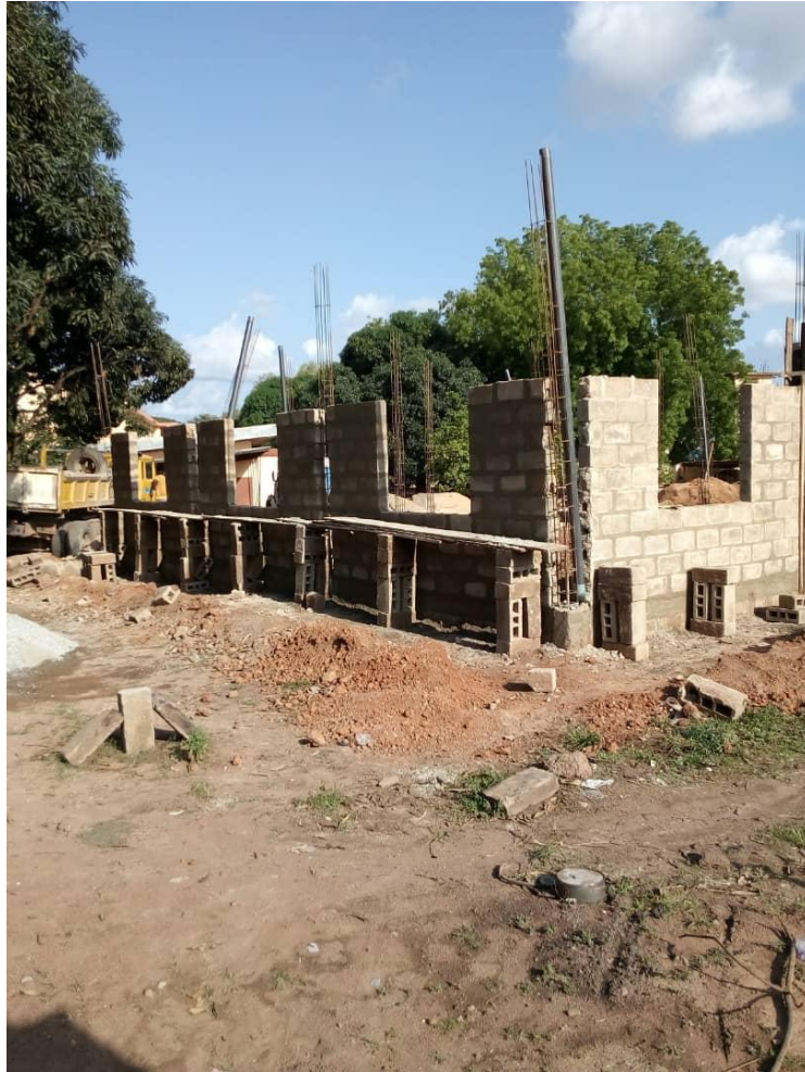
Avancée des travaux de la bibliothèque (12 juin 2019)