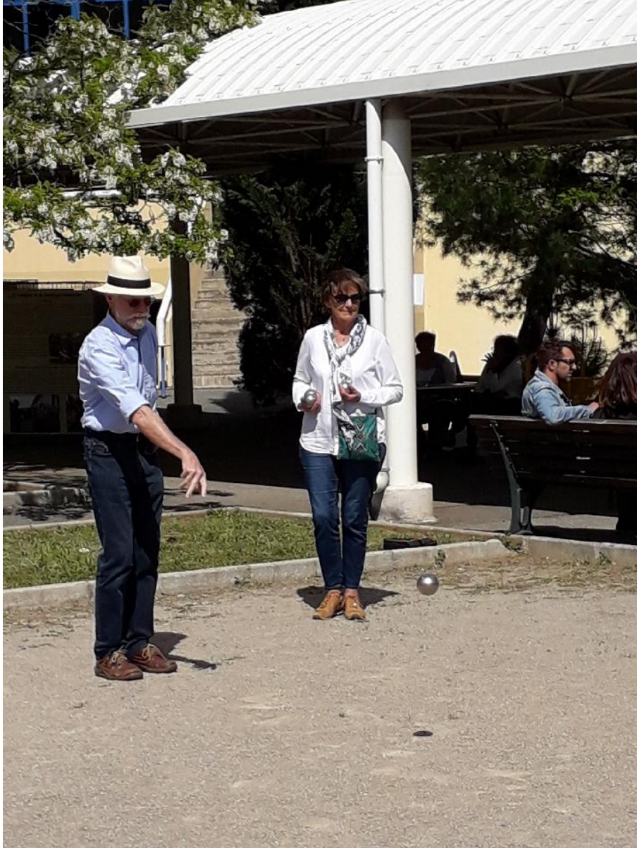
Concours de boules