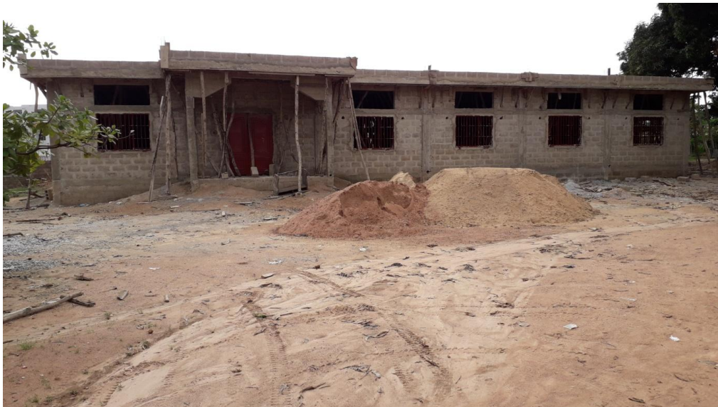
Avancée des travaux au 12 août 2019