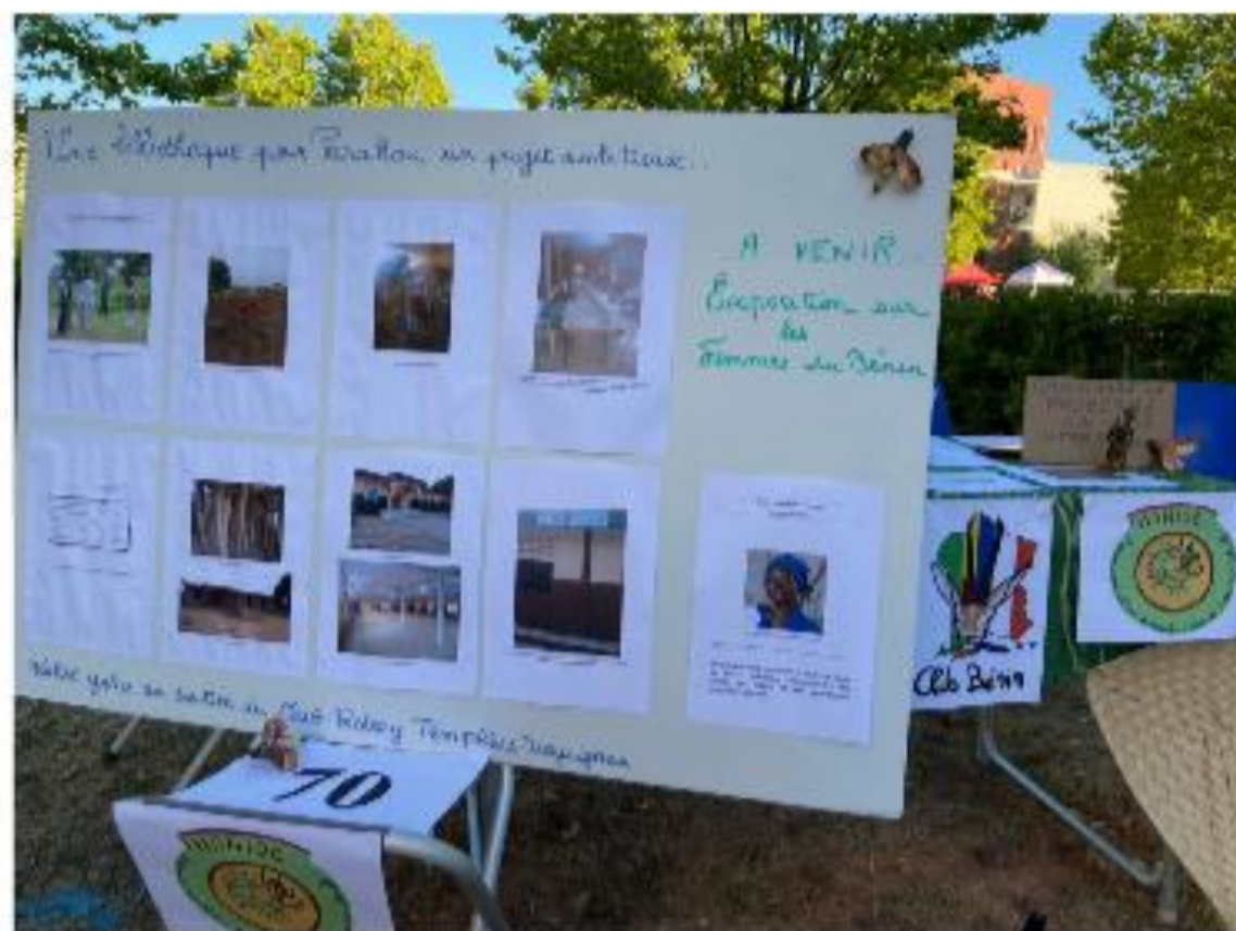
Stand Manioc-Club Bénin à la JDA

Septembre 2021 : Journée des Associations et présentation du Club aux lycéens lors de la journée de présentation des clubs du lycée.